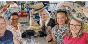
Hüte hoch für ein langes Pfingstweekende voller Musik, Sommerabende und guter Laune: Die Cowgirls und -boys aus der Herde genießen das Wolfhager Country-Festival sichtlich.

Zwischen Strohballen und Sommermeise fühlt alles plötzlich weniger nach Festival als ob nach einem kleinen Kurz- urlaub mitten in Nordhessen. „Die Hälfte der Leute, die ver- her mit Country nichts am Hut hatten, sind mit Hut nach Hause gegangen“, sagt Krüger und lacht. Dessen Klänge währenddessen die Beats im Takt über- geben. Krüger setzt die Musik ein, fällt sich die Entzifferung wie ein selbst. Die große Linedance-Community, die aus ganz Deutschland angereist ist, Ort, an dem niemand lange still sitzen bliebe. Bands wie „Colorado Five“ oder „Jed Mountain“ liefern dafür einen Sound- track zwischen Festival, Frei- zeitsgefühl und Wildwest- an diesem Sonntagabend.