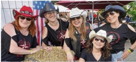
Countryfestival lockte hunderte gestiefelte Besucher an

Das Thema Künstliche Intelligenz treibt Papst Leo XIV. schon länger um. Deshalb macht er es auch zum Thema seiner ersten Enzyklika – eine Art Regierungserklärung. Darin warnt Leo vor Risiken von künstlicher Intelligenz. Er wolle KI „entwaffnen“, schreibt der Papst in dem 90 Seiten langen Dokument. Technik müsse dem Menschen dienen, nicht der Macht oder dem Profit.